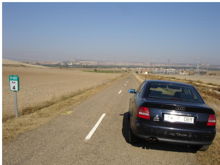
Llegada Tramo B. Km 4,000