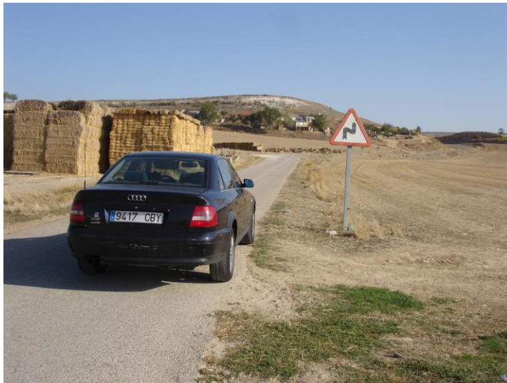
Salida Tramo A. Punto Km 10,800