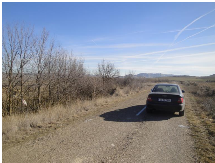
Llegada Tramo D. Punto Km 1,540