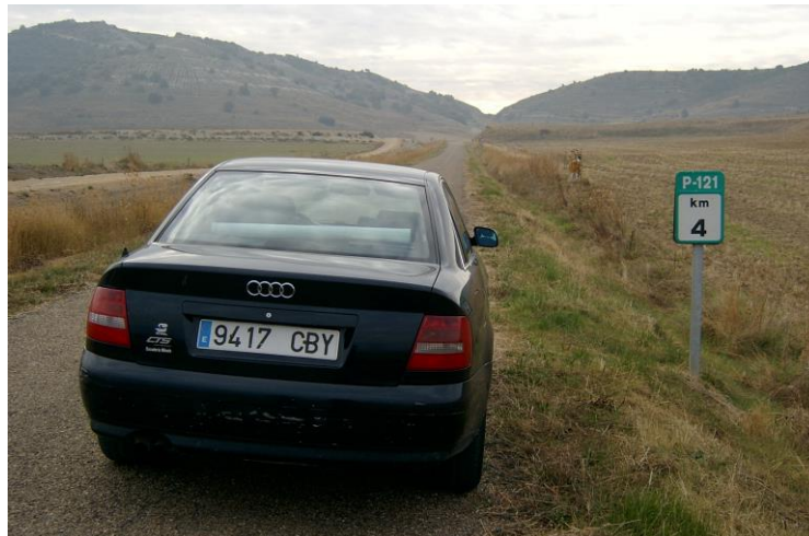
Salida Tramo C. Km 4,000