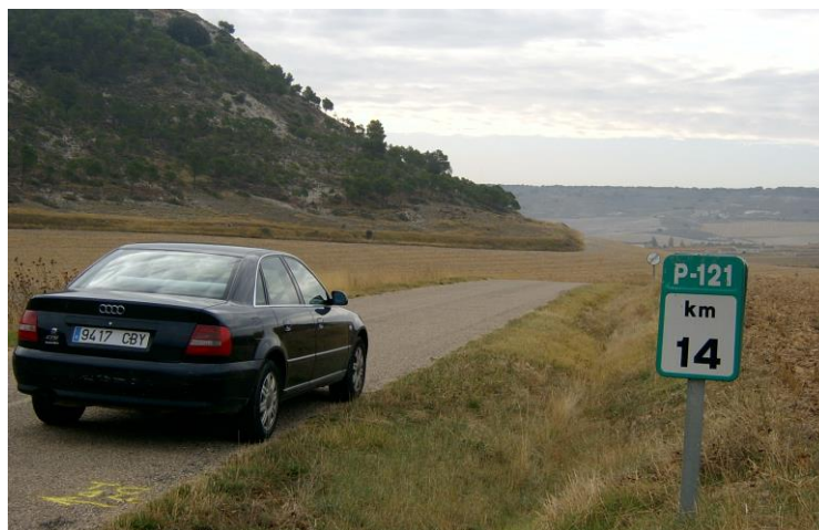
Llegada Tramo C. Km 14,000