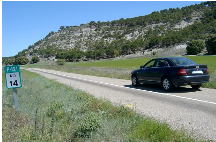
Salida Tramo B. Km 14,000