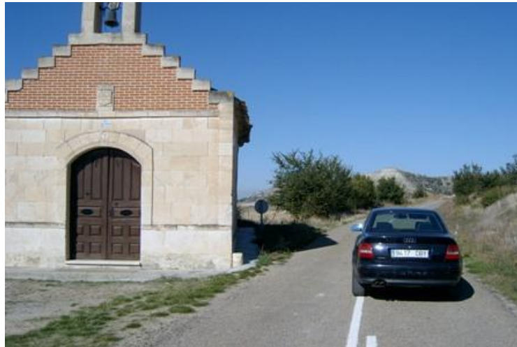
Salida Tramo D. Frente a la Ermita