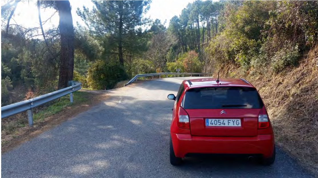
Salida: Km. 2,000 de la AV-924